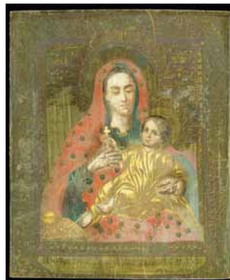
Förlorad och återfunnen. Guds moders undergörande ikon av Kozelshtshan.

Sedan 1881 har mirakel skett i anslutning till originalikonen och den reproduktion, gjord i Poltava 1885, som i dag finns i Uspenskij-katedralen i Helsingfors. Ikonen stals i juni 2010 från katedralen och återfanns sex månader senare nedgrävd i en jordhåla utanför Åbo. Ikonen har efter restaurering visats upp i ortodoxa kyrkor i Finland och Estland. Nu har turen kommit till Stockholm, där den kommer att förevisas lördagen den 24 mars i samband med öppningen av en ikonutställning hos den finska ortodoxa församlingen. Information finns på www.ortodox-fnisk.se .